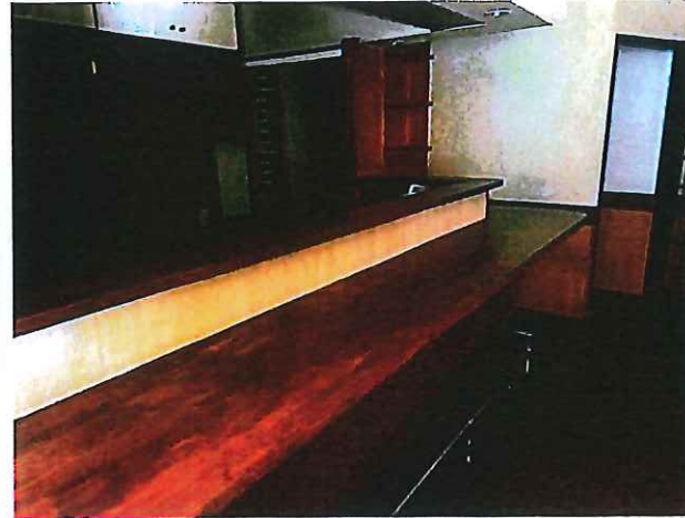
勝手口からの写真