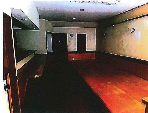
勝手口からの写真